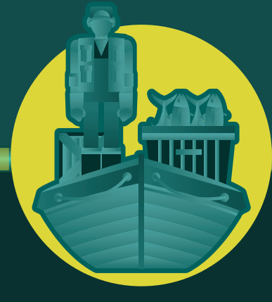
USUARIOS DE RECURSOS