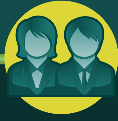
TOMADORES DE DECISIONES